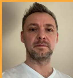
Marco / Videolink abspielen