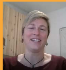
Livia / Videolink abspielen